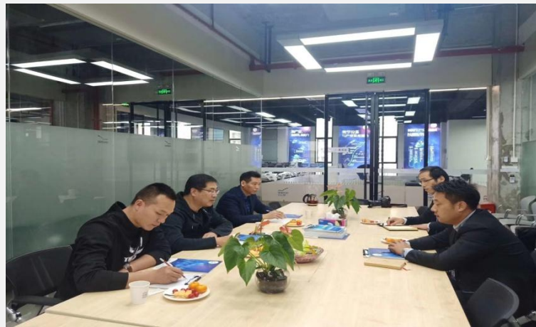
与深圳行云（新能）科技有限公司交流人才培养模式及课程体系改革