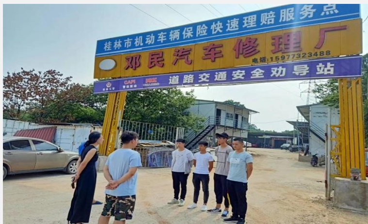
教务科领导及专业教师到企业参观交流，并指导学生实习

(2) 优化课程体系，增强学生就业竞争力及岗位适应力。 通过企业调研，逐步建立理实一体化的课程体系。